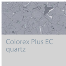
Colorex Plus EC quartz